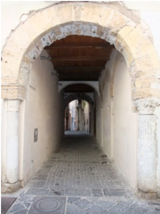
Salerno centro storico

De inschrijving is vanaf dit jaar simpeler geworden. U kunt uw voorkeur kenbaar maken door een email te zenden naar MFWBerger@Jinshinhealing.com Let erop dat u aangeeft welke kuurweek uw voorkeur heeft, bijvoorbeeld Salerno Week 1 of Diest Week 2. Ook kunt u naar www.jinshinhealing.com/kuurweek/inschrijven.asp gaan en daar uw voorkeur aangeven. Het is van het grootste belang om dit zo snel mogelijk te doen omdat de kuurweken gewoonlijk erg snel ingevuld.