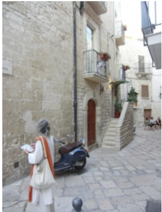
Onderkomen in Bari

Bari is een prachtig kustplaatsje in Zuid Italië aan de Adriatische zee. Het heeft een zeer aantrekkelijk